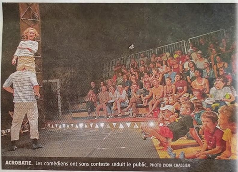
ACROBATIE. Les comédiens ont sans conteste séduit le public.

Au plafond du chapiteau, est suspendue une ampoule. Une ampoule haut perchée, donc, que les co-